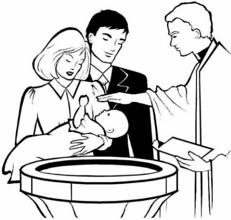
Rửa Tội Trẻ Em Infant Baptism

Nhờ ơn bí tích Hôn Phối, cha mẹ nhận trách nhiệm và đặc quyền giáo dục đức tin cho con cái, Cha Mẹ là những sứ giả đầu tiên của đức tin, khai tâm cho con về các mầu nhiệm đức tin từ lúc chúng còn nhỏ. Họ phải đưa con cái, hòa nhập vào đời sống của Hội Thánh ngay từ lúc còn thơ bé. Nếp sống gia đình có thể tạo nên những tâm tình tốt đẹp, chuẩn bị và nâng đỡ đức tin sống động cho con trong suốt cuộc đời” (GLCG 2225)