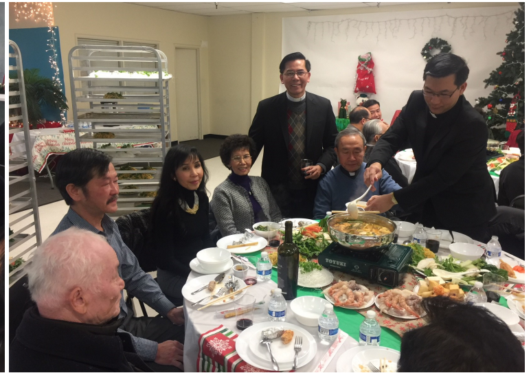
Trong tuần vừa qua, giáo xứ có buổi tiếp tân chào đón các Ơn Gọi trong giáo xứ vào bữa tiệc mừng Giáng Sinh do Hội Bảo trợ Ơn Thiên Triệu trong giáo xứ khoản đãi.