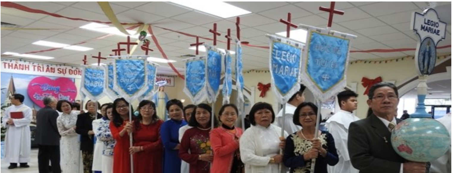
Đại diện các Tiểu Đội trong nghi đoàn dâng thánh lễ.

Ngày đầu năm mới, giáo hội mừng kính trọng thể lễ Đức Maria Mẹ Thiên Chúa. Hội Đạo Binh Đức Mẹ Curia Mẹ Thiên Chúa đã mừng kính trọng thể lễ Đức Maria Mẹ Thiên Chúa Bồn Mạ của Curia vào lúc 10 giờ 30 sáng thứ Hai ngày 01 tháng 01 năm 2018. Curia Mẹ Thiên Chúa là Đội Legio Maria của người Công Giáo Việt Nam trong toàn Tổng Giáo Phận Seattle gồm 12 Tiểu Đội được hoạt động từ Everett đến tận Tacoma. Số Hội Viên hoạt động trung bình mỗi Tiểu Đội trên dưới 10 Hội Viên, ngoài ra số Hội Viên Tán Trợ trải dài từ các Cộng Đoàn Địa phương cũng như trong Giáo xứ khá đông đảo. Vài hình ảnh của lễ Đức Maria Mẹ Thiên