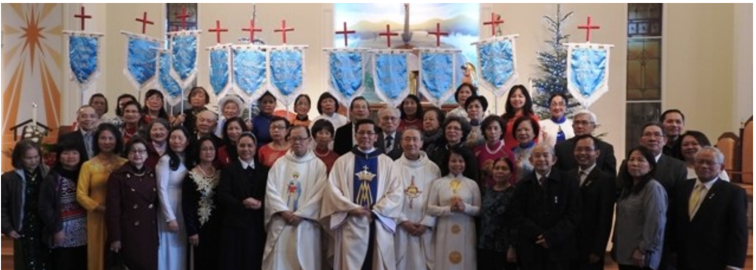
Các Hội Viên Legio Maria, đại diện trong 12 Tiểu Đội chụp hình lưu niệm sau thánh lễ.