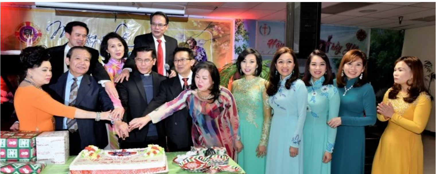
Cắt bánh mừng Bồn Mạ Gia Đình Nazareth.