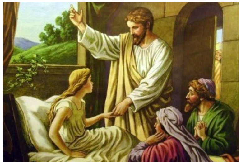
JESUS HEALS THE SICK