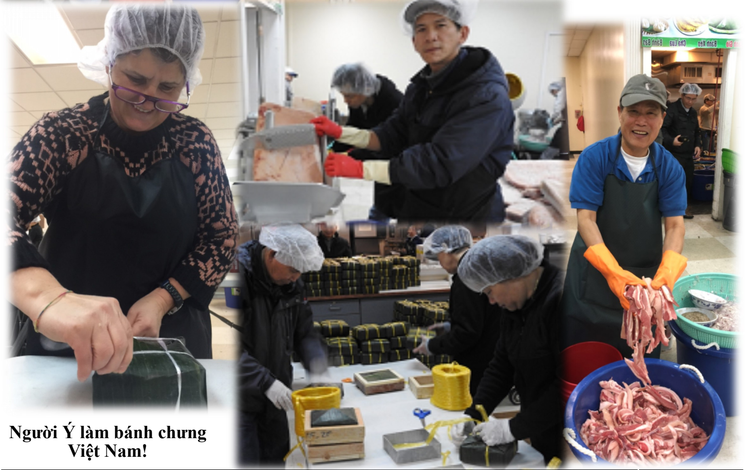
Người Ý làm bánh chưng Việt Nam!