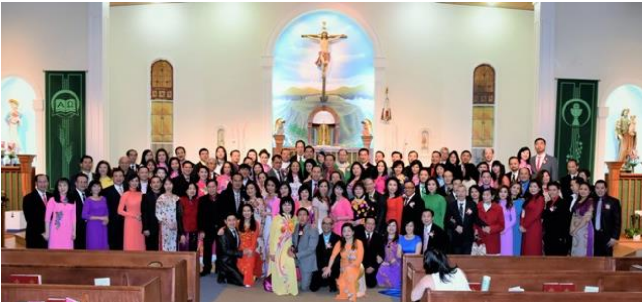
Các đôi vợ chồng thuộc gia đình Nazareth mừng ngày Tình Yêu

Năm nay ngày lễ tình yêu rơi vào ngày thường nên Gia Đình Nazareth của giáo xứ long trọng mừng ngày Tình Yêu vào thứ bảy ngày 11 tháng 2 năm 2017 lúc 6 giờ chiều. Đông đảo các đôi vợ chồng thuộc gia đình Nazareth đã sốt sắng dâng thánh lễ tạ ơn và sau đó đã cùng nhau họp mặt thân hữu tại Hội trường giáo xứ.