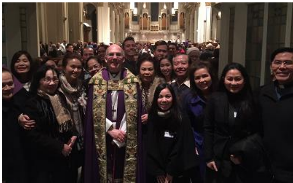
Nghi Thức Dự Tông: Thứ hai vừa qua Đức TGM đã gặp gỡ anh chị em Dự Tông và đã cử hành nghi thức tiếp nhận Dự Tông một cách long trọng theo luật Giáo Hội. Tại buổi cử hành nghi thức tiếp nhận có sự hiện diện của cha chánh xứ và các người đỡ đầu

*Trong tuần qua đông đảo các anh chị phụ trách các lớp Giáo Lý, Việt Ngữ Đặc Lộ cùng các trưởng Thiếu Nhi Thánh Thể Đoàn Chúa Hải Đông đã tham dự buổi tinh tâm đặc biệt để cùng nhau trao đổi và dẫn thân phục vụ tốt mọi công tác trong vai trò hướng dẫn các em thăng tiến trong đời sống Đức Tin