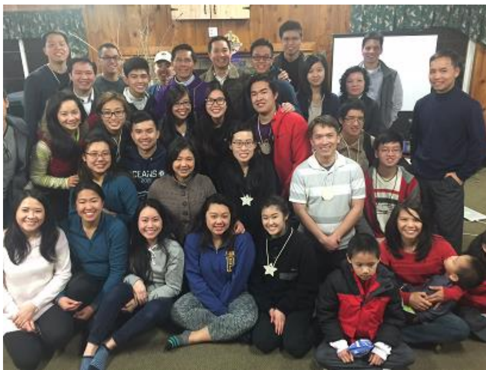
Hình ảnh các anh chị phụ trách giáo lý Việt Ngữ Đặc Lộ, Thiếu Nhi Thánh Thể tinh tâm

*Trong tuần qua đông đảo các anh chị phụ trách các lớp Giáo Lý, Việt Ngữ Đặc Lộ cùng các trưởng Thiếu Nhi Thánh Thể Đoàn Chúa Hải Đông đã tham dự buổi tinh tâm đặc biệt để cùng nhau trao đổi và dẫn thân phục vụ tốt mọi công tác trong vai trò hướng dẫn các em thăng tiến trong đời sống Đức Tin