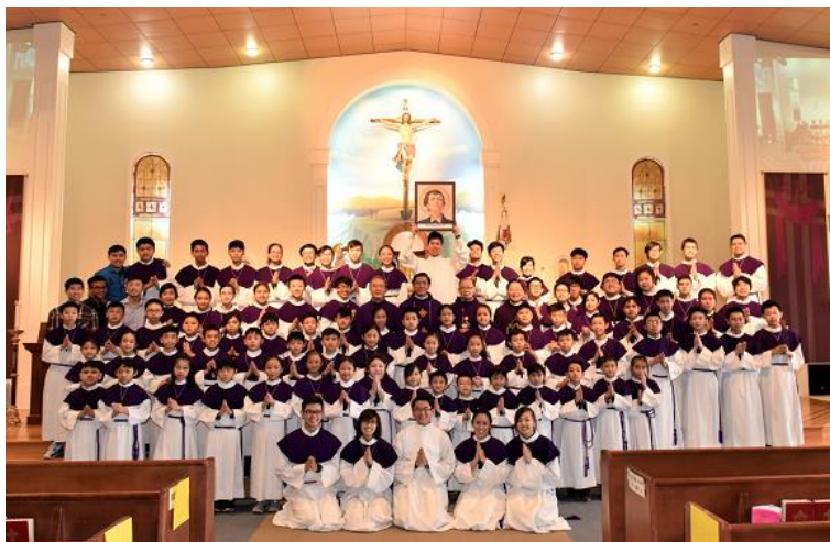
Các em lễ sinh chụp hình chung lưu niệm

Chúa Nhật đầu tháng 3, trong niềm vui tạ ơn, giáo xứ vui mừng chào đón các em lễ sinh trong ngày vui mừng lễ Bổn Mạng của Ban Lễ Sinh. Các em chọn thánh Dôminicô Saviô làm Quan Thầy. Tạ ơn Chúa giáo xứ đã có khá đông đảo các em tham gia việc phục vụ bàn thánh một cách hăng say và nhiệt tình, gần 100 em thay phiên nhau phục vụ bàn thánh trong các thánh lễ từ ngày thường cũng như các thánh lễ cuối tuần và những ngày lễ trọng. Sở dĩ giáo xứ có được một đội ngũ các em giúp lễ đông đảo cũng là nhờ sự dẫn thân của các phụ huynh đã hy sinh thì giờ đưa đón các em một cách tích cực.