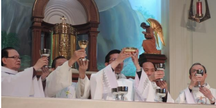
Quy Cha Đồng tế thánh lễ khai mạc