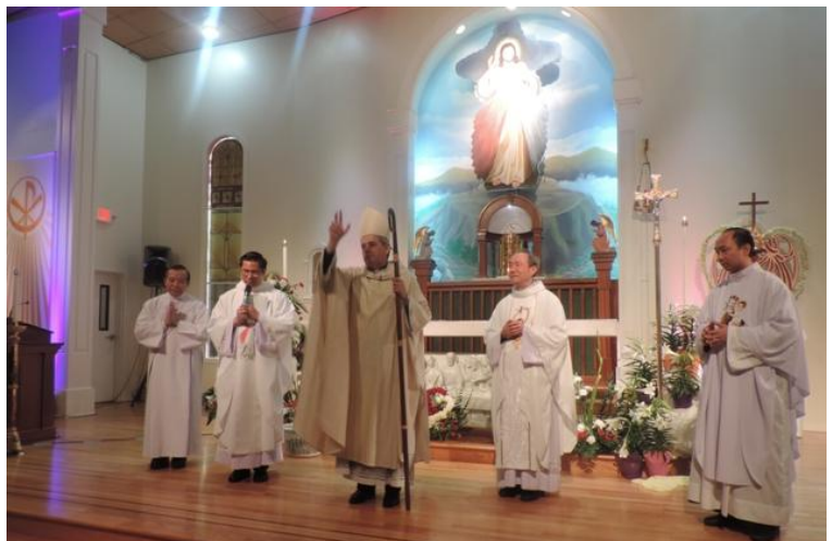
Đức Giám Mục Ban ơn toàn xá kết thúc Đại Hội