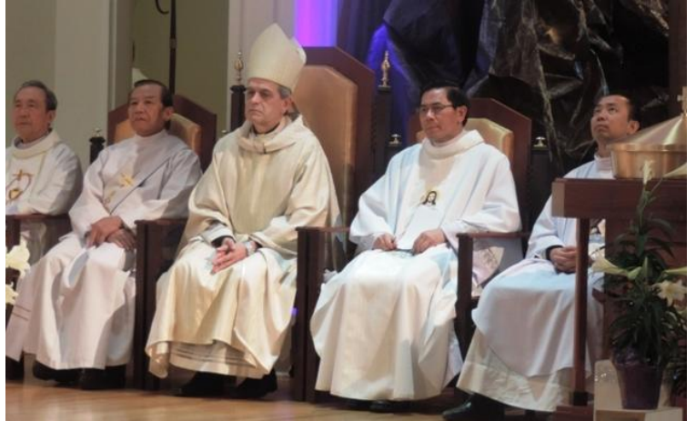
Đức Giám Mục và quý cha đồng tế thánh lễ đại trào