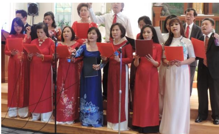
Ban hợp ca Giáo Đoàn Fatima