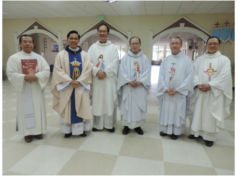
Linh mục đoàn đồng tế