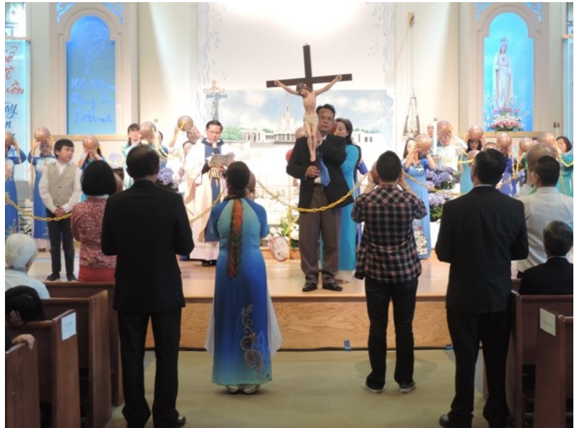
Đoàn Lành Mân Côi đa ngôn ngữ