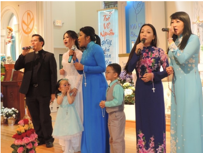
Hát Thánh ca mừng kính Mẹ