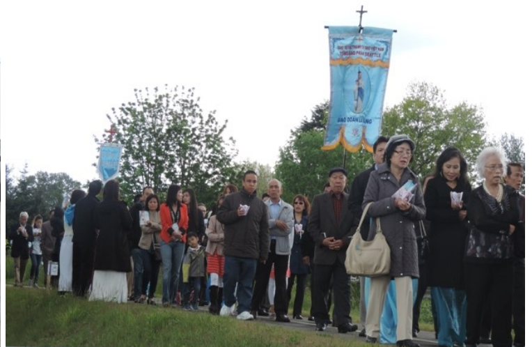
Vài hình ảnh đoàn kiệu cung nghinh Đức Mẹ