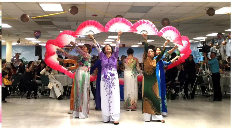
Quý Mẹ đa tài: không chỉ giỏi nấu ăn mà còn múa rất tuyệt vời!