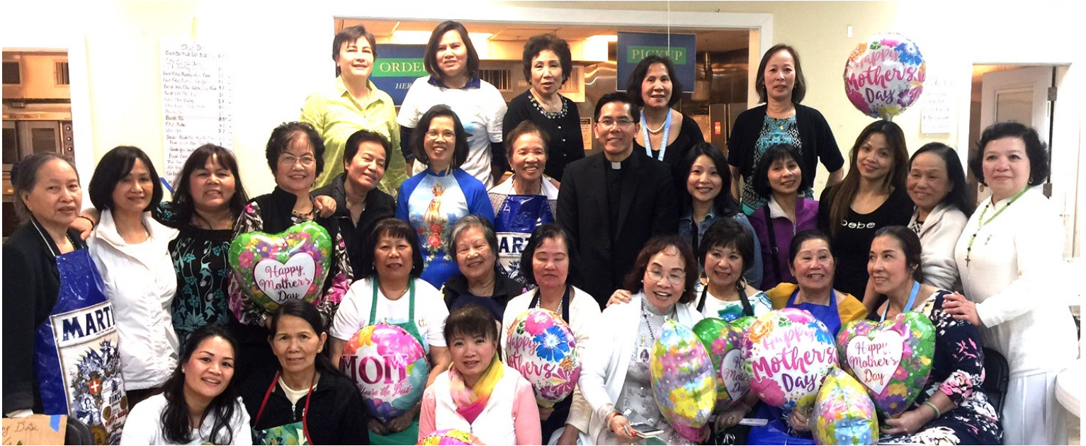
Cám ơn quý Mẹ đã hy sinh phục vụ quán ăn giáo xứ ngày Ngày Lễ Hiền Mẫu !