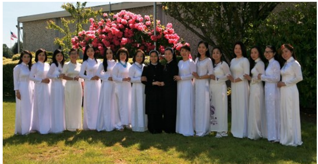
Ban Giảng Viên chụp hình lưu niệm