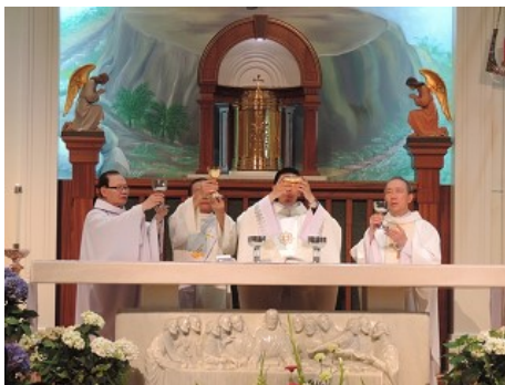
Quý Cha đồng tế thánh lễ