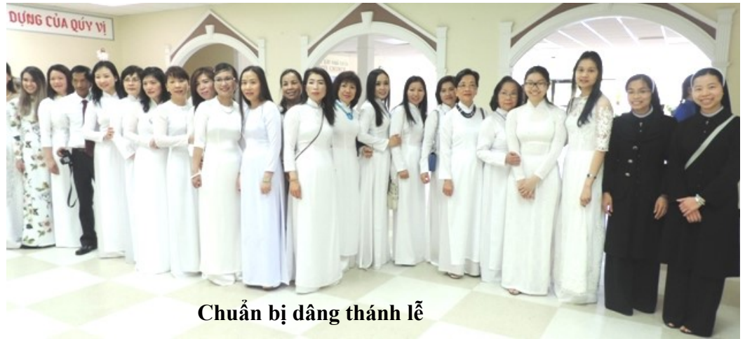
Chuẩn bị dâng thánh lễ

Trong niềm vui tạ ơn, giáo xứ chúc mừng trường Việt Ngữ Đắc Lộ trong ngày mừng lễ Bổn Mạng. Giáo xứ tri ân Ban Giảng Viên cùng các phụ huynh trường Việt Ngữ Đắc Lộ đã hy sinh thời gian công sức và tài chánh để nuôi dưỡng tinh thần phục vụ duy trì nền văn hóa Việt nơi cộng đoàn giáo xứ. Ngoài công tác dạy tiếng Việt cho các em, Ban Giảng Viên cũng đã hướng về các công tác phụng vụ, giáo dục đức tin cho các em qua các buổi diễn nguyện, dâng hoa, rước kiệu vãn vãn. Để duy trì và phát triển tiếng Việt nơi đây, giáo xứ mời gọi các bạn trẻ tham gia vào ban giảng viên đông đảo hơn, để phong trào dạy tiếng Việt ngày càng phong phú hơn. Xin Chúa chúc lành và ban cho các cô thầy, quý phụ huynh luôn tìm được niềm vui khi dấn thân phục vụ.