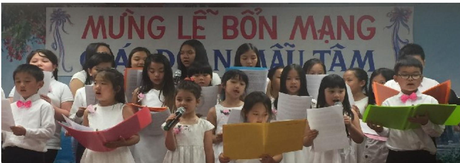
Ca Đoàn Chiền Con giúp vui văn nghệ