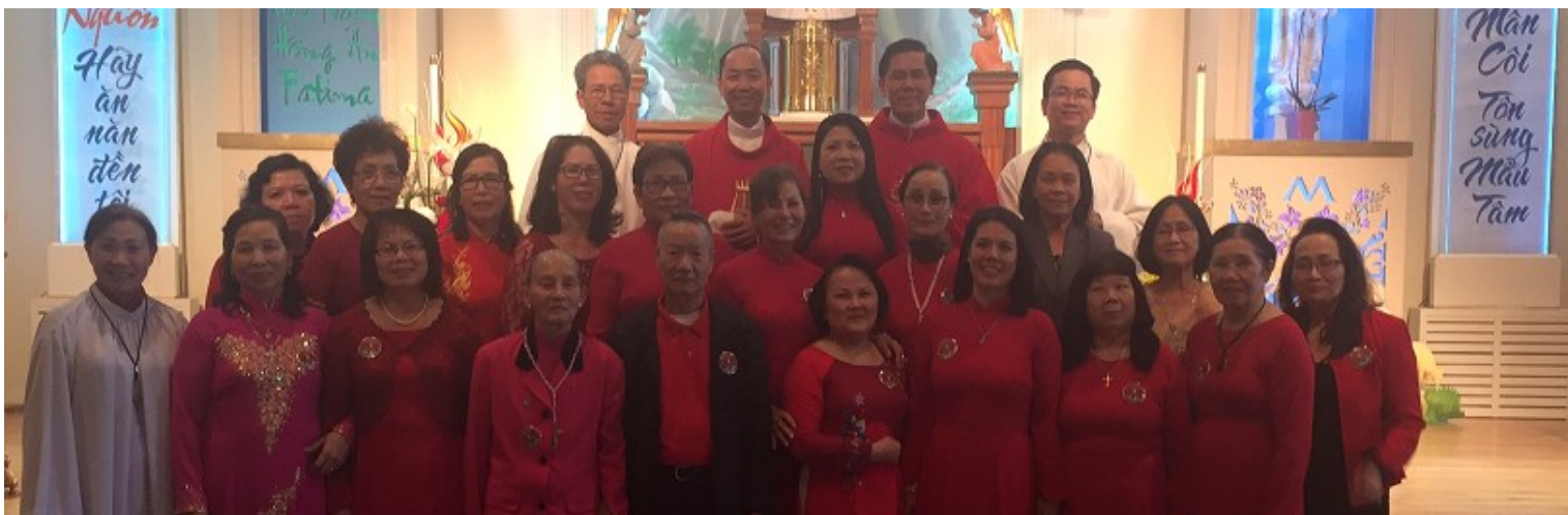
Hội Canh Tân Đặc Sủng Thánh Linh mừng BỔN MẠNG