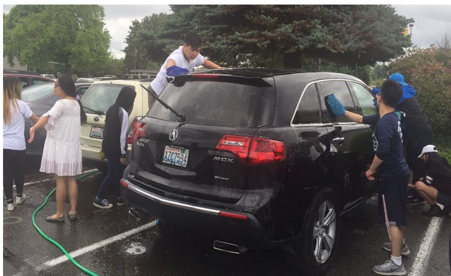
Các em rửa xe gây quỹ giúp người nghèo