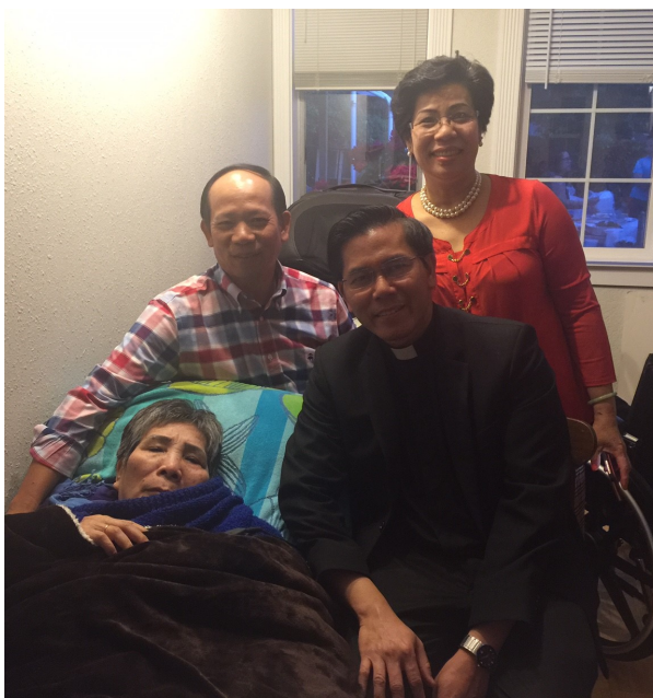
Thăm bệnh nhân