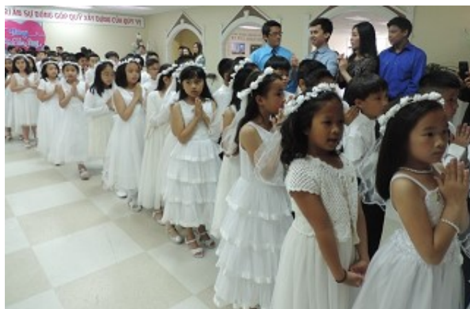
Các em chuẩn bị dâng thánh lễ.

Giáo xứ chào mừng các em lần đầu được đón nhận Bí Tích Thánh Thể. Đây là bước đầu mà các em đón Chúa ngự vào tâm hồn của mỗi em và nhờ đó các em bắt đầu sống gần Chúa và trở nên thân thiện với Chúa để được Chúa nâng đỡ mọi nơi và mọi lúc.