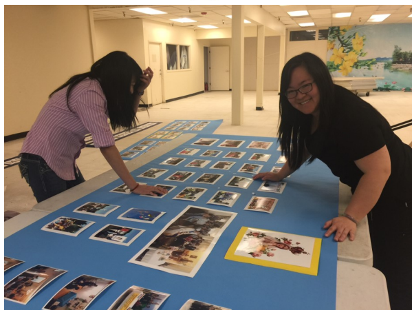
Phục vụ trang trí

Lạy Chúa, xin giúp con luôn sống phục vụ yêu thương (Mt 20:28).