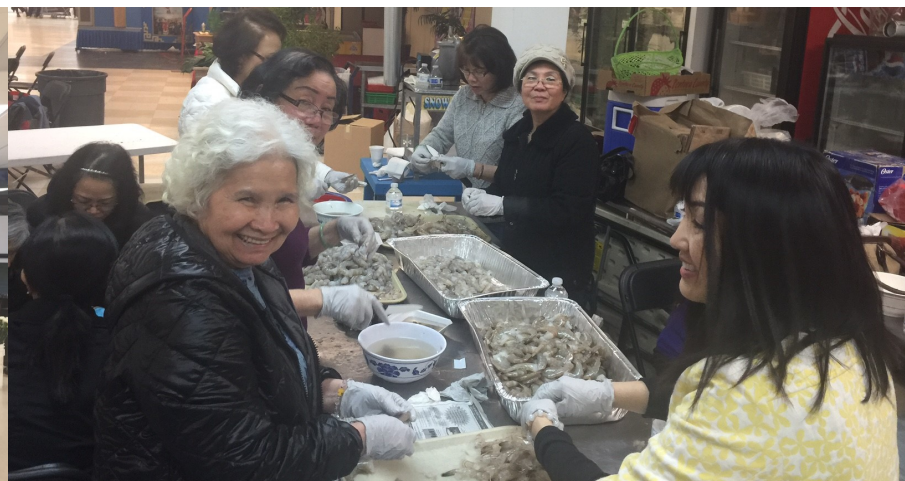
Phục vụ giáo xứ