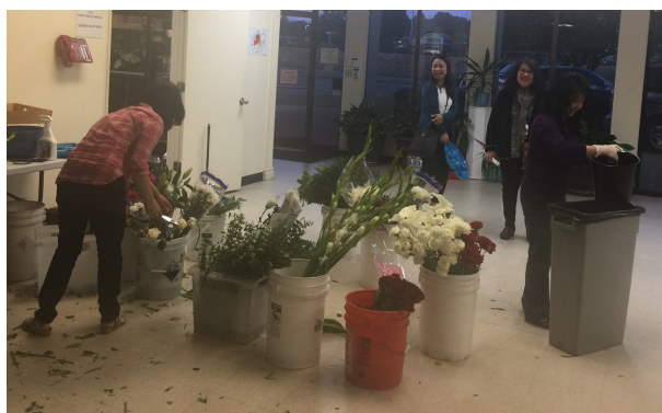
Phục vụ cắm hoa

Ở mọi nơi, luôn chiếu tỏa lòng Chúa hiền hậu và khiêm nhường (Mt 11:29)