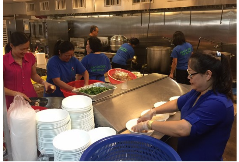
Ông Đặng hăng say phục vụ quán ăn một cách nhiệt tình