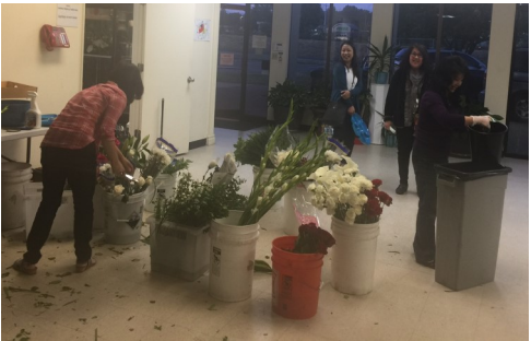
Phục vụ cắm hoa