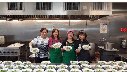
Phục vụ giáo xứ