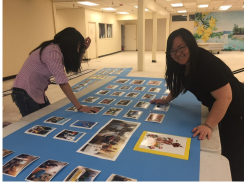
Phục vụ trang trí