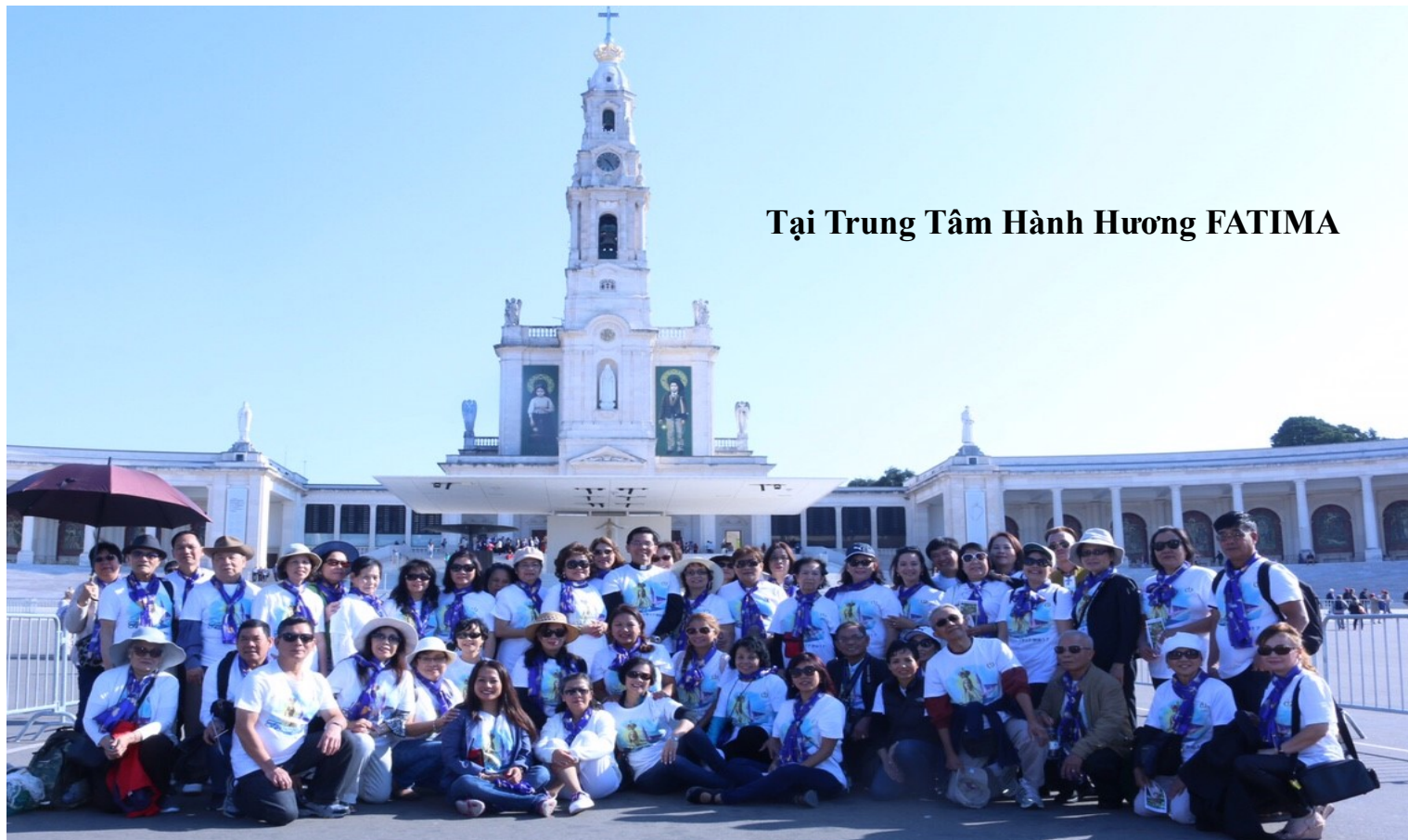
Tại Trung Tâm Hành Hương FATIMA

Chào mừng đoàn hành hương của giáo xứ đã trở về trong sự bình an. Đoàn hành hương trong 10 ngày đã viếng nhiều nơi hành hương đặc biệt Trung Tâm Hành Hương Fatima mà giáo hội mừng kính 100 năm Đức Mẹ hiện ra tại Fatima và viếng nhiều nơi thánh tích tại Roma.