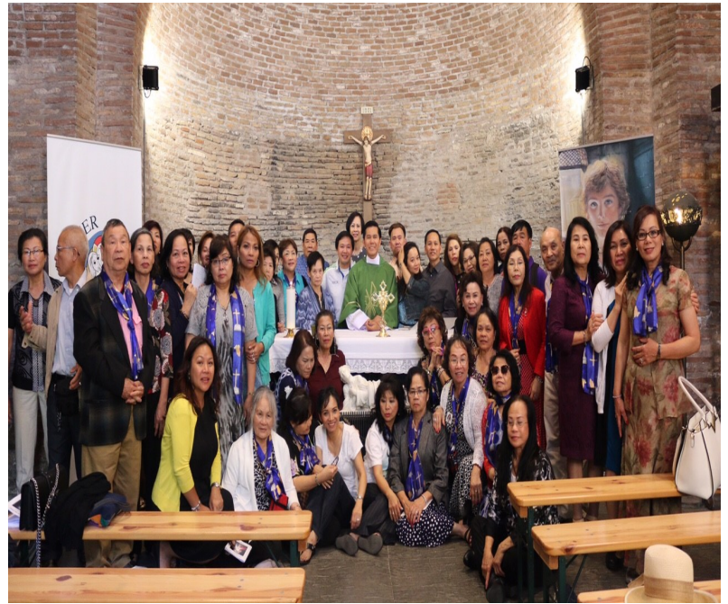
Tại hang toại đạo Callixto

Kỷ niệm những ngày hành hương Châu Âu September, 2017