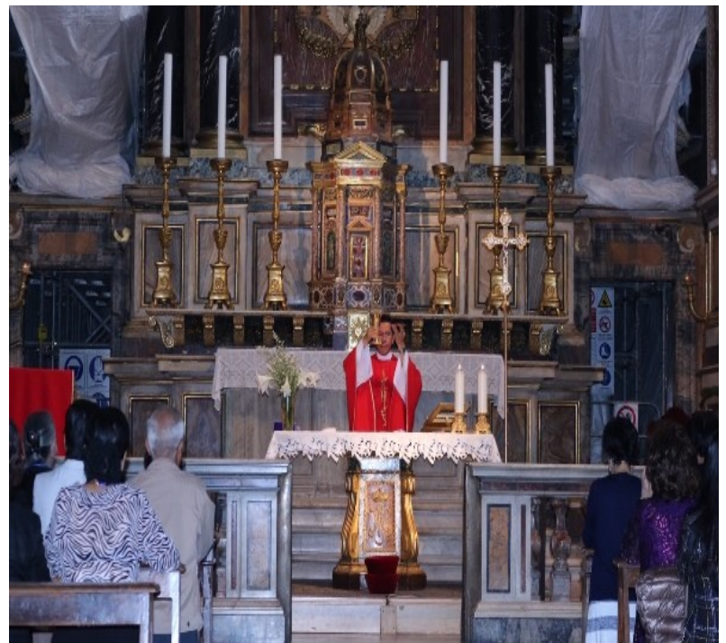
Đoàn hành hương dâng thánh lễ tại nhà thờ Augustinô nơi có phần mộ của Monica