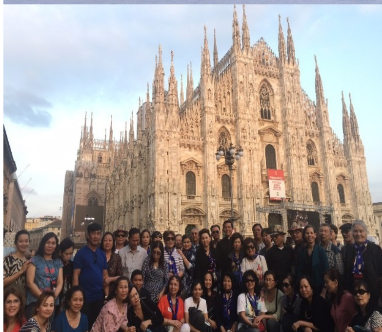
Trước Nhà thờ Chánh Toà Milano ở Ý