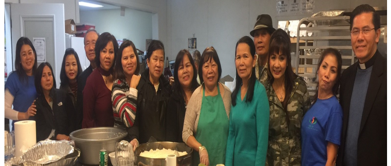
Nhóm "Phụ Huynh Học Sinh" phục vụ quán ăn vào tuần thứ Năm của tháng