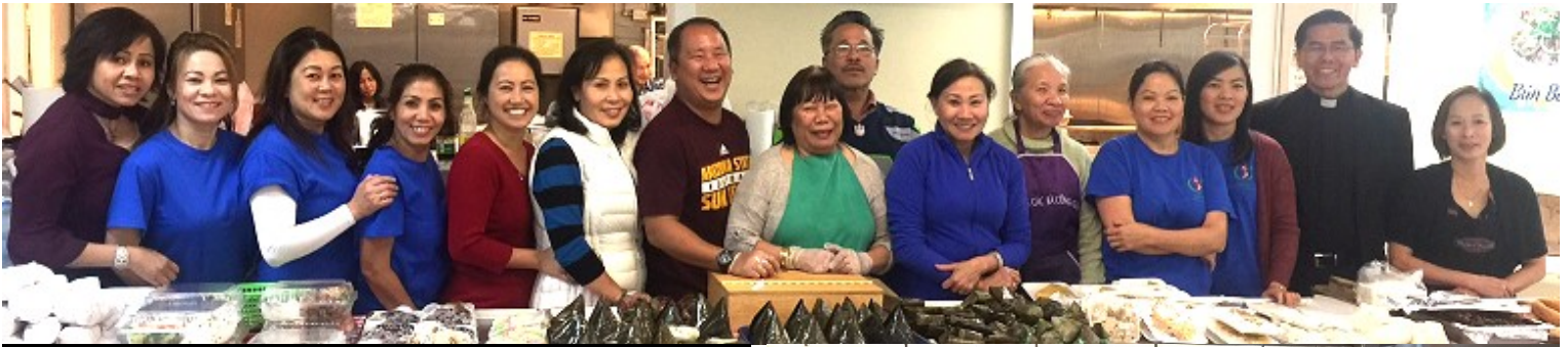
Nhóm "Phụ Huynh Học Sinh" phục vụ quán ăn