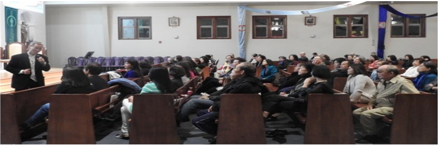
Đông đảo giáo dân tham dự buổi tĩnh tâm Mùa Vọng 2017