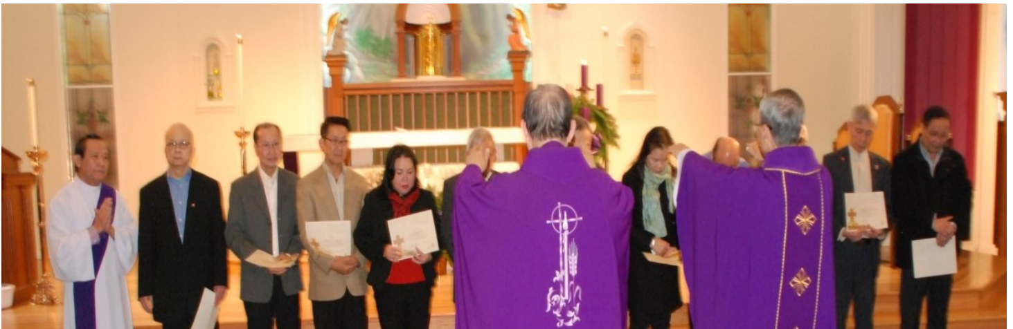
Quý cha chúc lành cho quý anh chị lớp Kinh Thánh

Một số anh chị đã tham gia Lớp Học Kinh Thánh được tổ chức tại giáo trong thời gian qua và được Toà Giám Mục Seattle cấp CHỨNG CHỈ LỚP THÁNH KINH, chúa nhật vừa qua quý anh chị đã nhận lãnh Chứng Chỉ do cha Nguyễn Sơn Miên chủ sự. Quý anh chị đã đón nhận phép lành trọng thể do quý cha chúc lành trong thánh lễ 11:30 Chúa Nhật 03 tháng 12 năm 2017