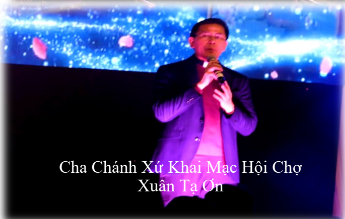
Cha Chánh Xứ Khai Mạc Hội Chợ Xuân Ta Ôn