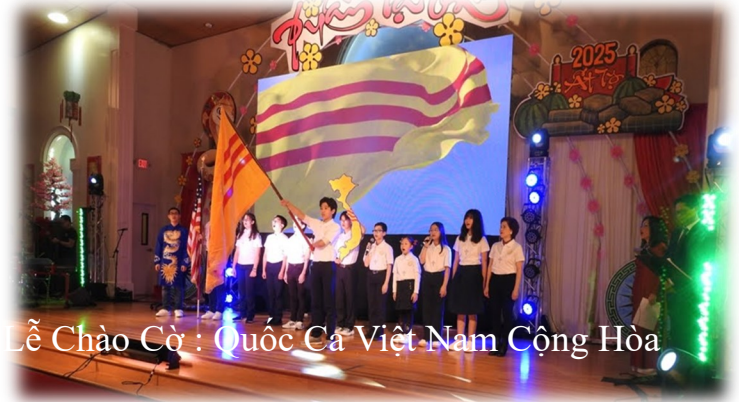
Lễ Chào Cờ : Quốc Ca Việt Nam Cộng Hòa