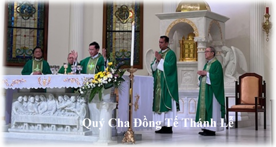
Quý Cha Đồng Tế Thánh Lễ