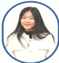
Rose of Lima Nguyễn Hoàng Anh