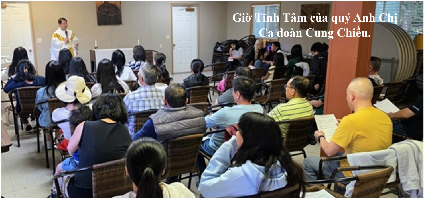
Giờ Tĩnh Tâm của quý Anh Chị Ca đoàn Cung Chiều.