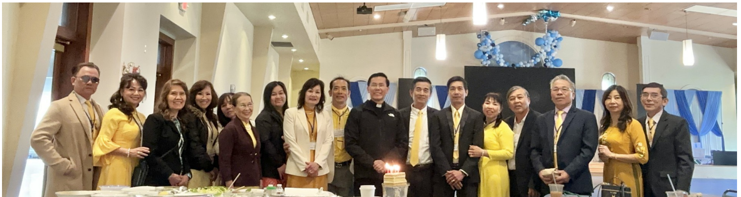
Ban Nghi Lễ - thánh lễ 7:30am mừng sinh nhật...