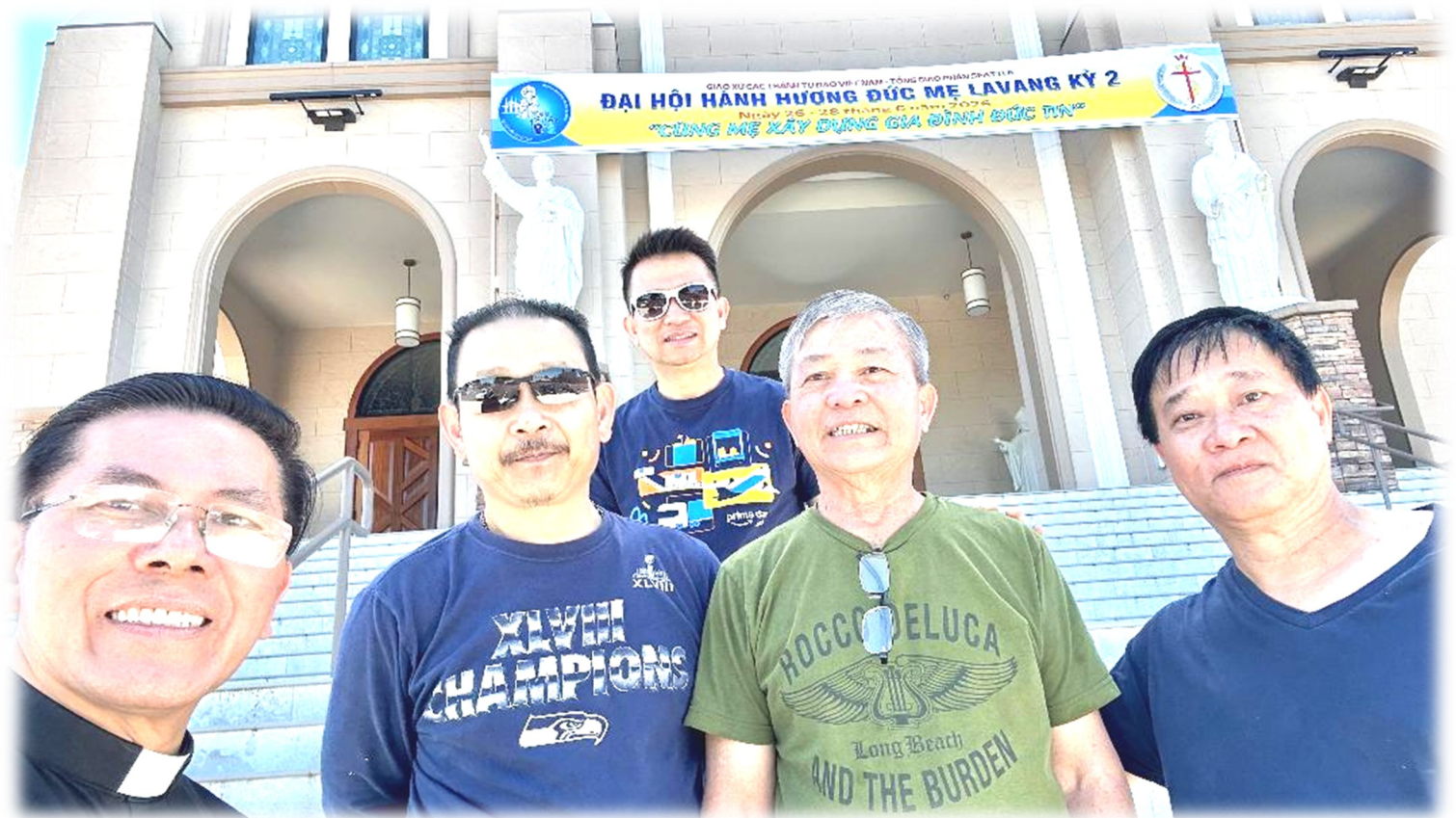
Thiện nguyện viên treo banners