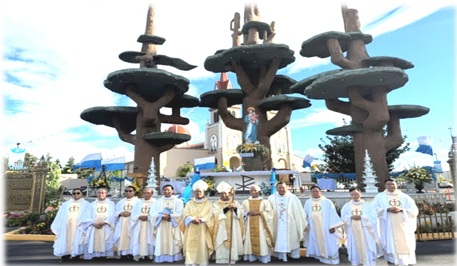
Quý Đức Cha và Quý Cha trong Thánh Lễ khai mạc Đại Hội