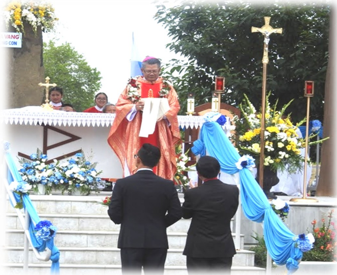
Chúc Mừng Đức Cha 25 Năm Giám Mục