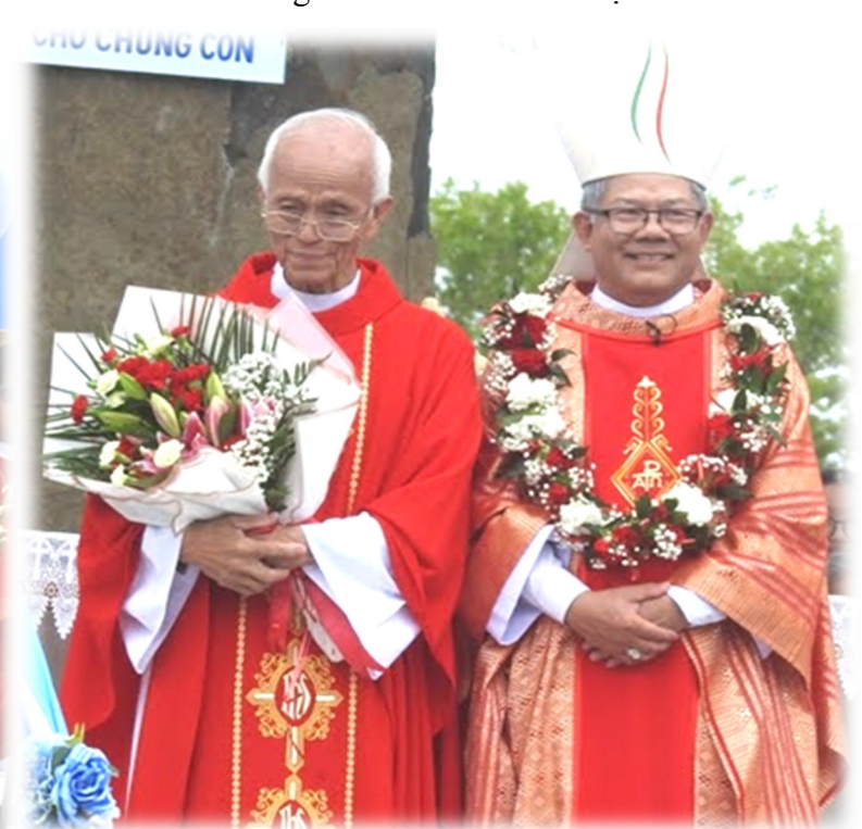
Đôi Rồng Đỏ đến từ Úc Châu