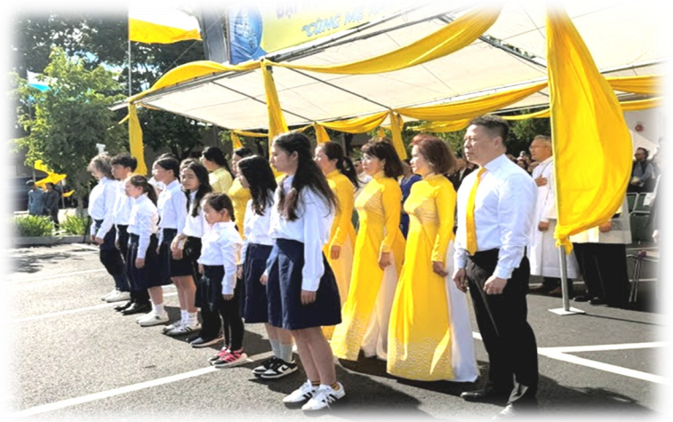
Lễ chào cờ khai mạc Đại Hội