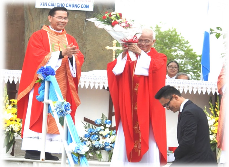
Chúc Mừng Cha 20 Năm Linh Mục