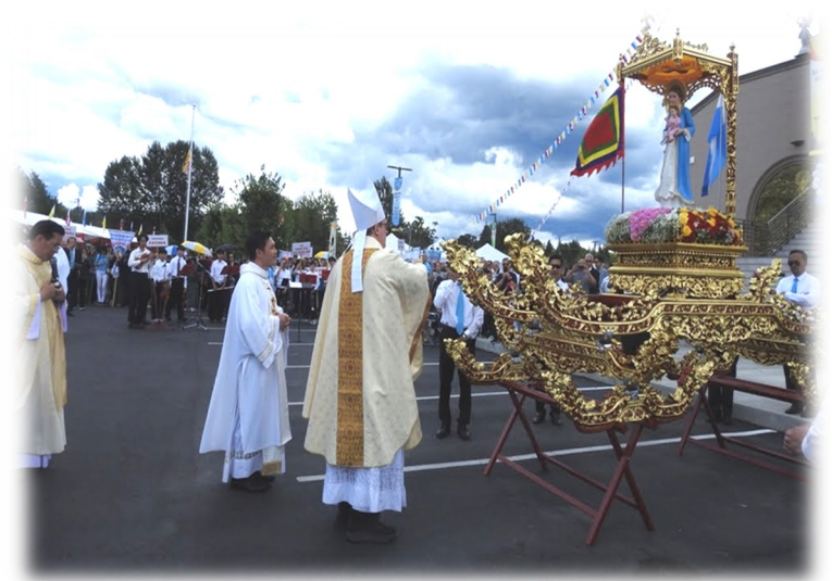
Đức Cha Frank Shuster chủ sự Rước Kiệu