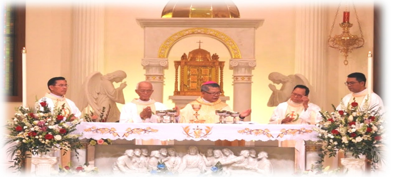
Thánh Lễ sáng thứ bảy kính Thánh Tâm Chúa