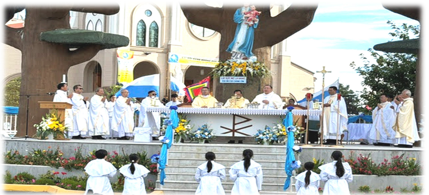
Thánh Lễ khai mạc Đại Hội