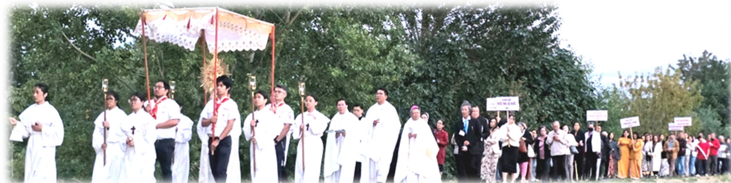
Cuộc Rước Kiệu và châu Thánh Thể ngoài trời vào đêm khai mạc Đại Hội