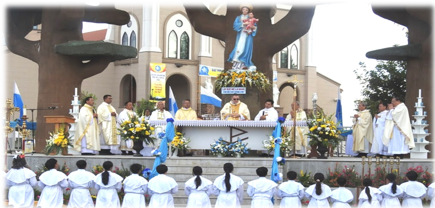
Thánh Lễ Đồng Tế