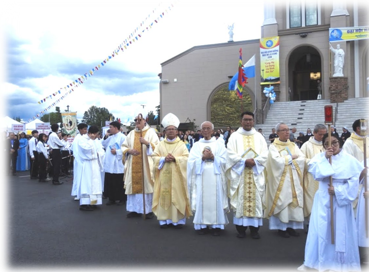
Quý Đức Cha và Quý Cha trong đoàn rước kiệu Đức Mẹ LaVang