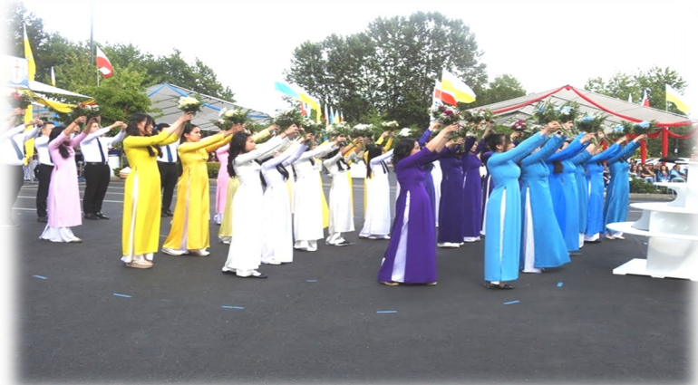
Dâng Hoa kính Đức Mẹ