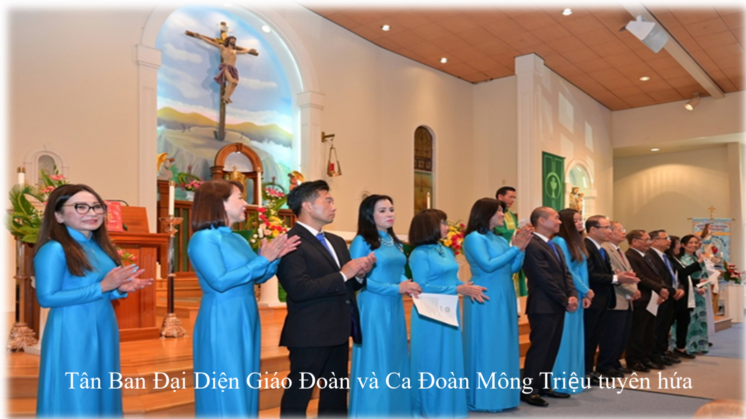
Tân Ban Đại Diện Giáo Đoàn và Ca Đoàn Mông Triệu tuyên hứa