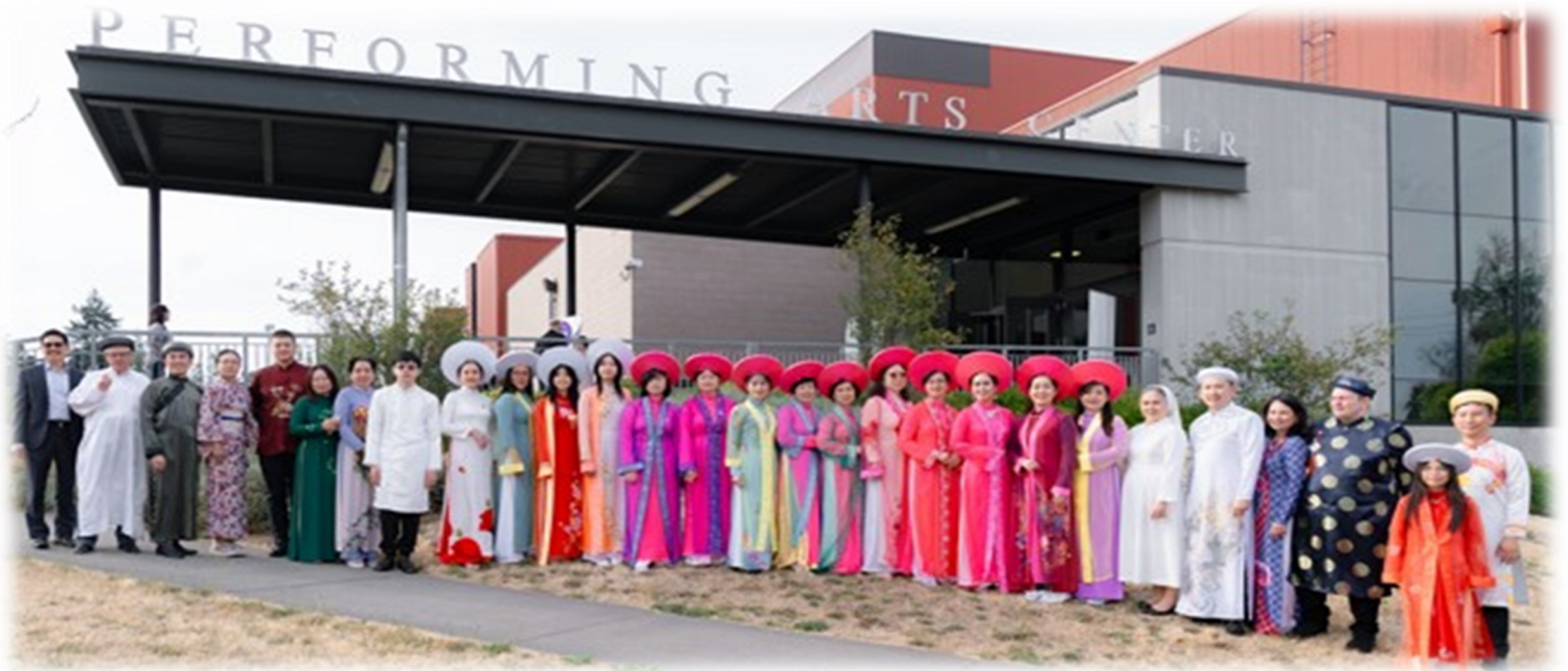
Hình Ảnh chụp chung Đoàn Văn Nghệ Hương Việt từ các tiểu bang về trình diễn tại Seattle